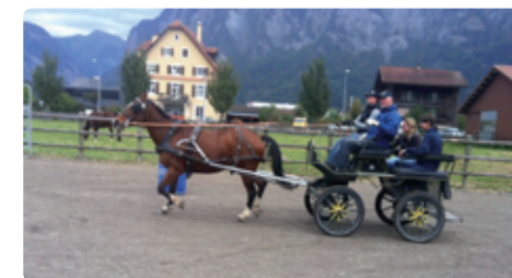
Mit eigenem oder Schul-Gespann