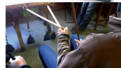
Theorie und Techniken

* Voraussetzung für die Brevetabnahme ist der Abschlusstest am 24.10.2015.