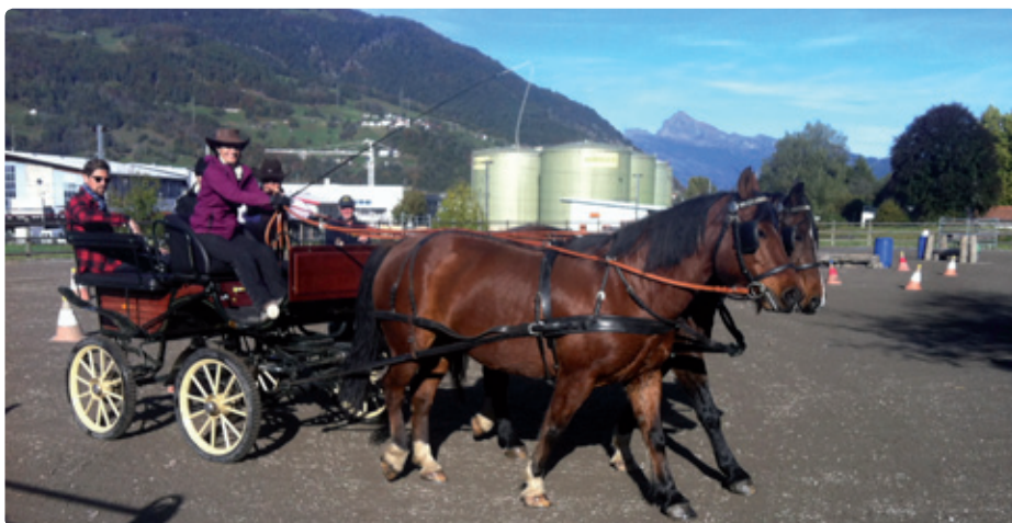
Eine Intensivwoche für Newcomer und Brevetierete mit Abschlusstest