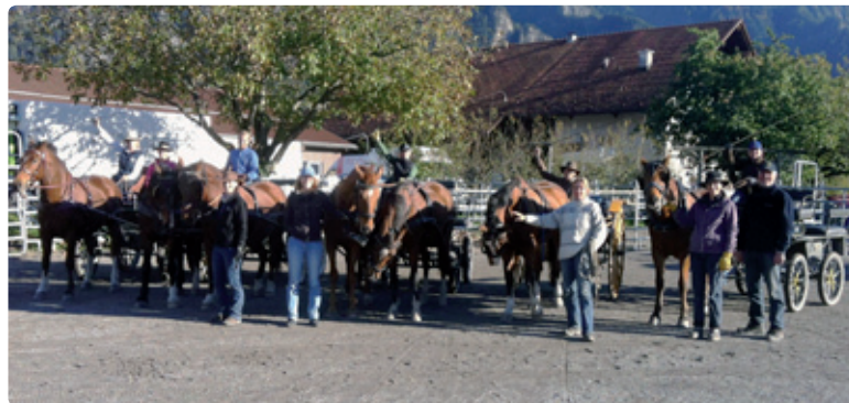
Teilnehmer im Gespannfahrkurs, Oktober 2014, auf der Kursanlage in Landquart